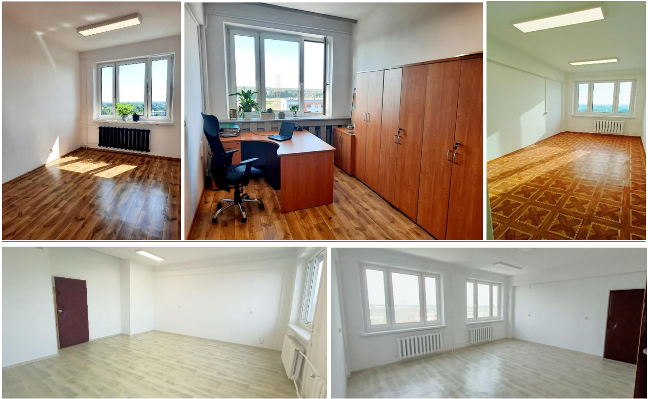
Przykładowe zdjęcia pomieszczeń o pow. 15m 2 i 35-60 m 2

Obecni Najemcy cenią sobie zielone otoczenie wokół budynku wraz z infrastrukturą towarzyszącą – ogólnodostępną altaną, ścieżką spacerową i siłownią zewnętrzną.